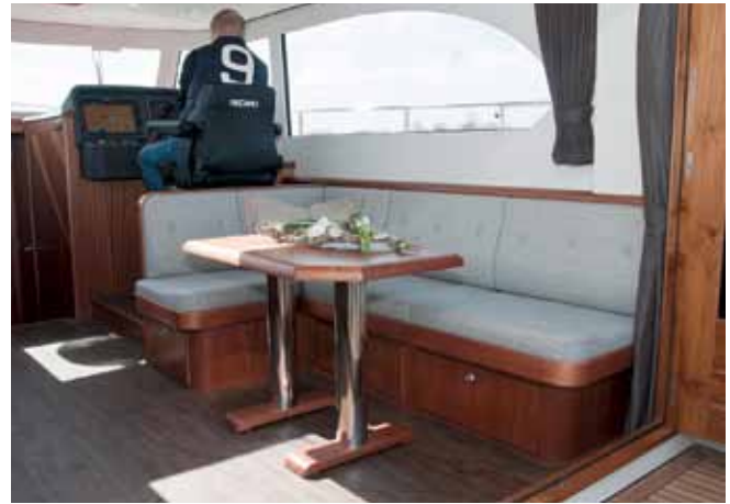
Blick in den hellen Salon mit L-förmiger Sitzgruppe und zugehörigem Tisch.

41 Sedan auf eine Durchfahrtshöhe von schlanken 2,43 m. Für die Festmacher stehen auf dem Vorschiff massive Doppelpoller, mittschiffs und am Heck zusätzlich je Seite drei Klampen zur Verfügung.