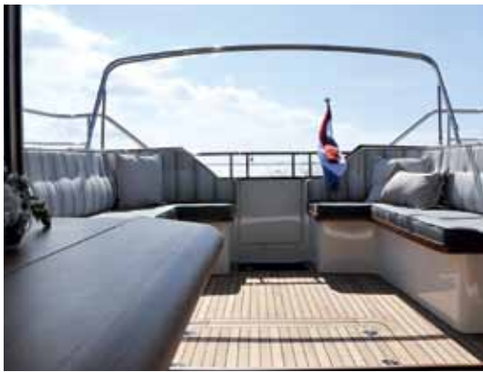
Große Plicht mit zwei einladenden Sitzbänken. Die weit öffnende Tür verbindet sie mit dem Salon