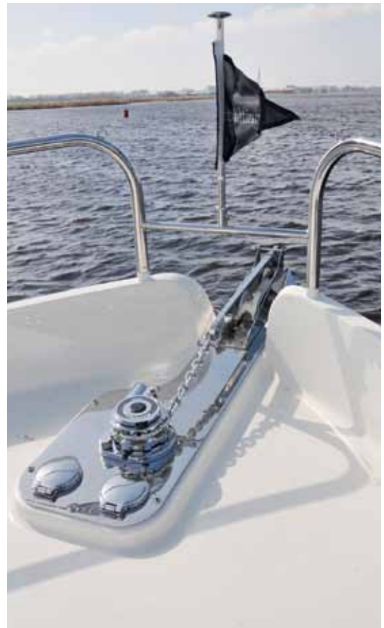
Die edle Anker-ausrüstung mit Edelstahlbeslag ist Bestandteil der Serienausstattung