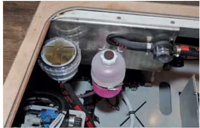
Der Kühlwasserfilter ist leicht zu kontrollieren und bei Bedarf auch zu reinigen

Lebensraum an und unter Deck. Vier Personen können an Bord auch längere Törns genießen. Die ausgesuchten Materialien und der hohe Standard der Verarbeitung sind weitere Pluspunkte der Yacht. In der Basisausführung, die aber schon mit kompletter Ankerinstal-