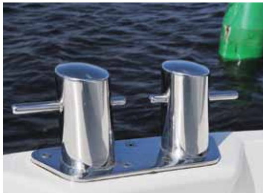
Solide Doppelpoller stehen auf dem Vorschiff bereit, ansonsten kommen Klampen zum Einsatz