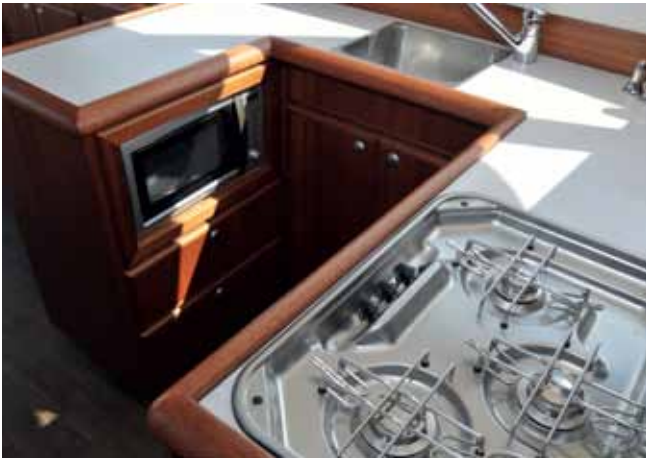
Die U-förmige Pantry auf kleinem Raum alles, was der Smut benötigt: Gasherd, Kühlschrank und Spüle