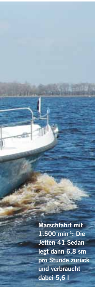
Marschfahrt mit 1.500 min -1 : Die Jetten 41 Sedan legt dann 6,8 sm pro Stunde zurück und verbraucht dabei 5,6 l